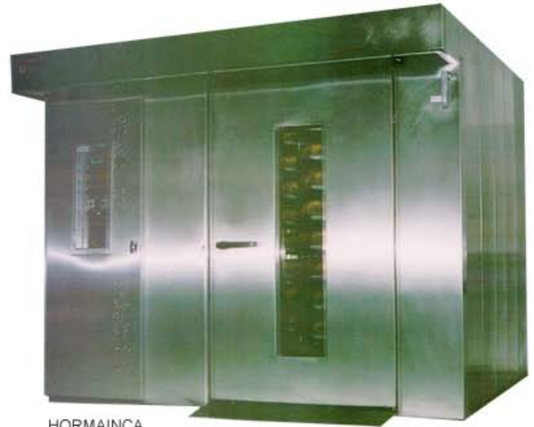
HORMAINCA MODELO: HORNO ROTATIVO DOBLE JUMBO

MARCA: HORMAINCA MODELO: HORNO ROTATIVO DOBLE JUMBO MEDIDAS DE BANDEJAS(Cm): 45x65 DIMENSIONES: 232X234 MEDIDAS mm: 940 x 1525 x 820 940 x 1205 x 820 940 x 1017 x 820 POTENCIA TERMICA (KCAL): 90.000. CARACTERISTICAS: controles automáticos de cocción, temperatura y vapor, quemador a gas, construidos en acero inoxidable y combinados.