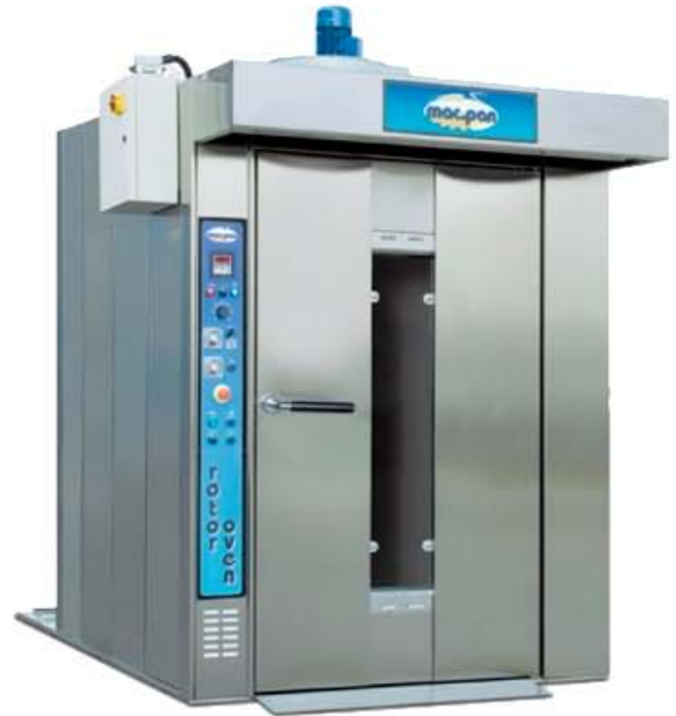
MAC PAN MODELO: MINI PHATON ELECTRICO

MARCA: MAC PAN MODELO: MINI PHANTON ELETRICO 1 (40X60) DIMENSIONES BANDEJAS: de 40x60 hasta 80x120 Características: Pueden funcionar con combustibile liquido o gaseoso y, a pedido, el calentamiento puede ser eléctrico, mediante resistencias blindadas. Costruidos con materiales de primera calidad, que garantizan una particular robustez y elevada elasticidad térmica.