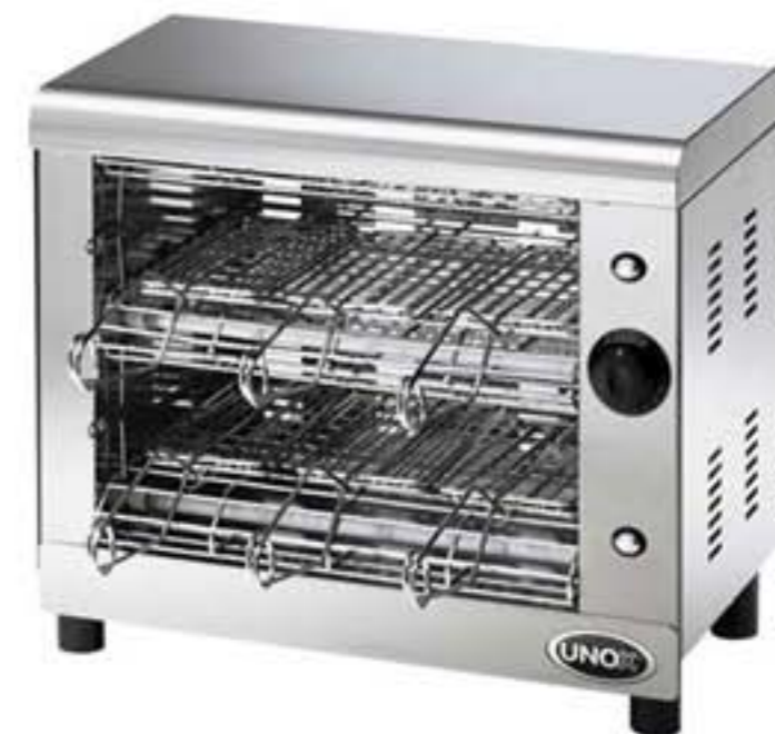
UNOX MODELO: XT 010- XT 020

MARCA: UNOX MODELO: XT 010 – XT 020 CARACTERÍSTICAS: Horno tostador de 2 cámaras.