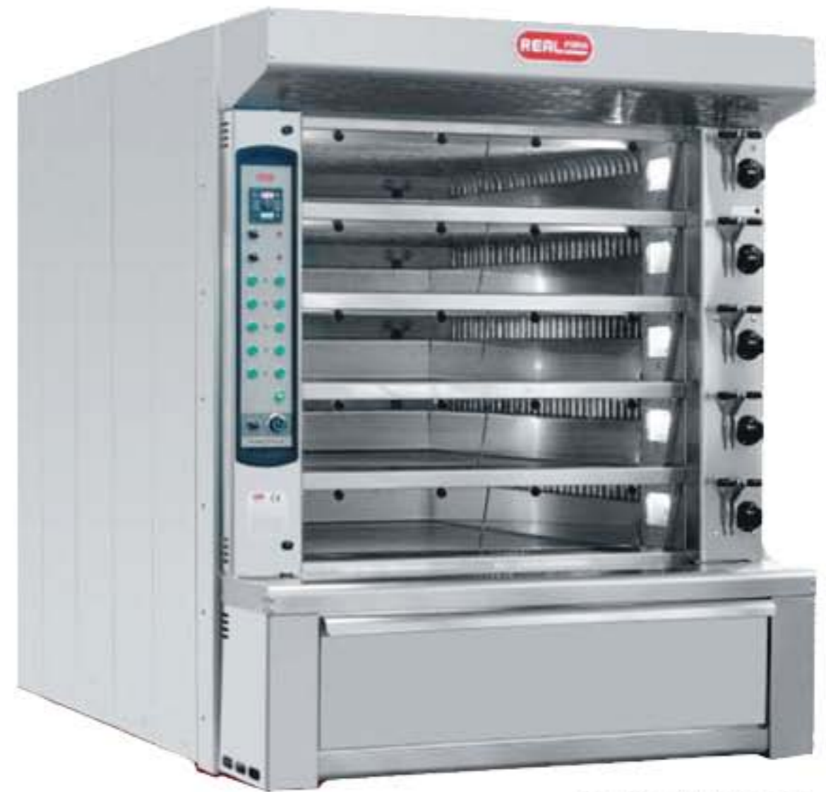
Real forni VAPOTECH MODELO: AT5C 7.70

Características: Horno con cámara de combustión metálica o ladrillo refractario controles de temperatura automática vapor y luz en cada cámara.