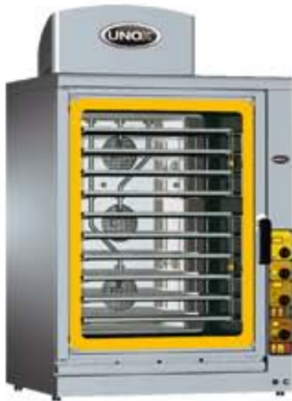
UNOX XG 813