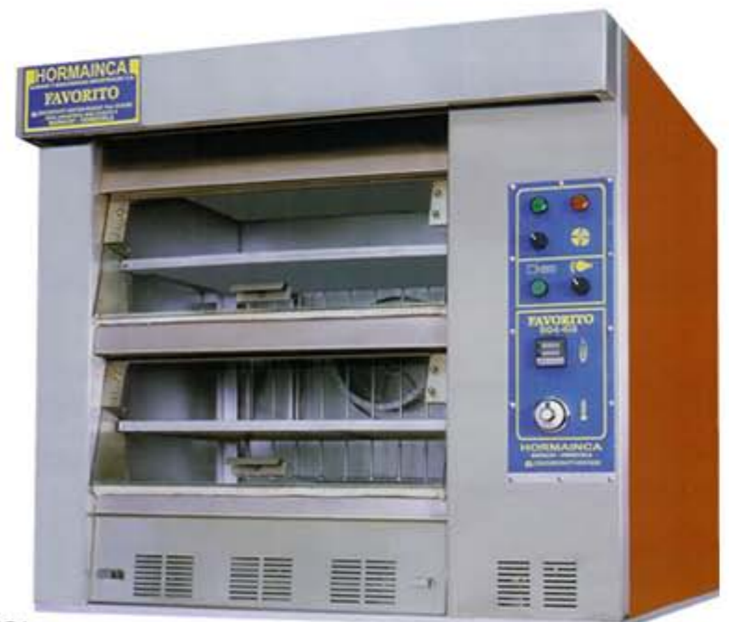
HORMAINCA MODELO: HORNO 904 G2

MARCA: HORMAINCA MODELO: HORNO 904 G2 EL FAVORITO DIMENSIONES: 110X104 PESO TOTAL: 490KG POTENCIA MOTOR: 1,2 Hp; 0.9 Kw; 3.0 Amp Características: Cámara de cocción con acero inoxidable, doble iluminación interna, capacidad hasta 4 bandejas, ahorro en el consumo de gas. pirometro indicador de temperatura, fácil y mínimo mantenimiento